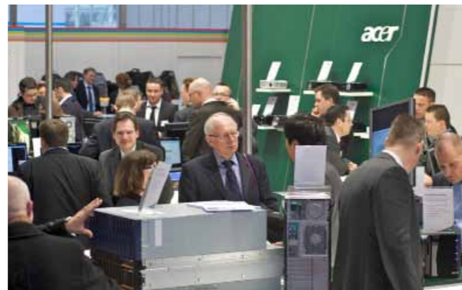
Business-Center: Der Planet Reseller rückt 2010 wieder in Zentrum der CeBIT in Halle 14 und 15

für Sie, üppiges Angebot bis hin zu Workshops, Marktanalysen und praktischen Anwendungen etwa von Digital Signage. Zahlreiche Neuaussteller haben sich bereits für den Planet Reseller 2010 angemeldet. So ist etwa Fujitsu Technology Solutions (ehemals FSC) dabei. Just Rams und Chips & More präsentieren das Trendthema Mobile Storage. Erstmals vertreten sind GSD Remarketing, die dem Fachhandel aufzeigen, wie mit Used IT höhere Margen realisiert werden können. Mehr Themen, mehr Aussteller, mehr Fläche, kurzum, der Planet Reseller 2010 wird besser, schöner, größer.